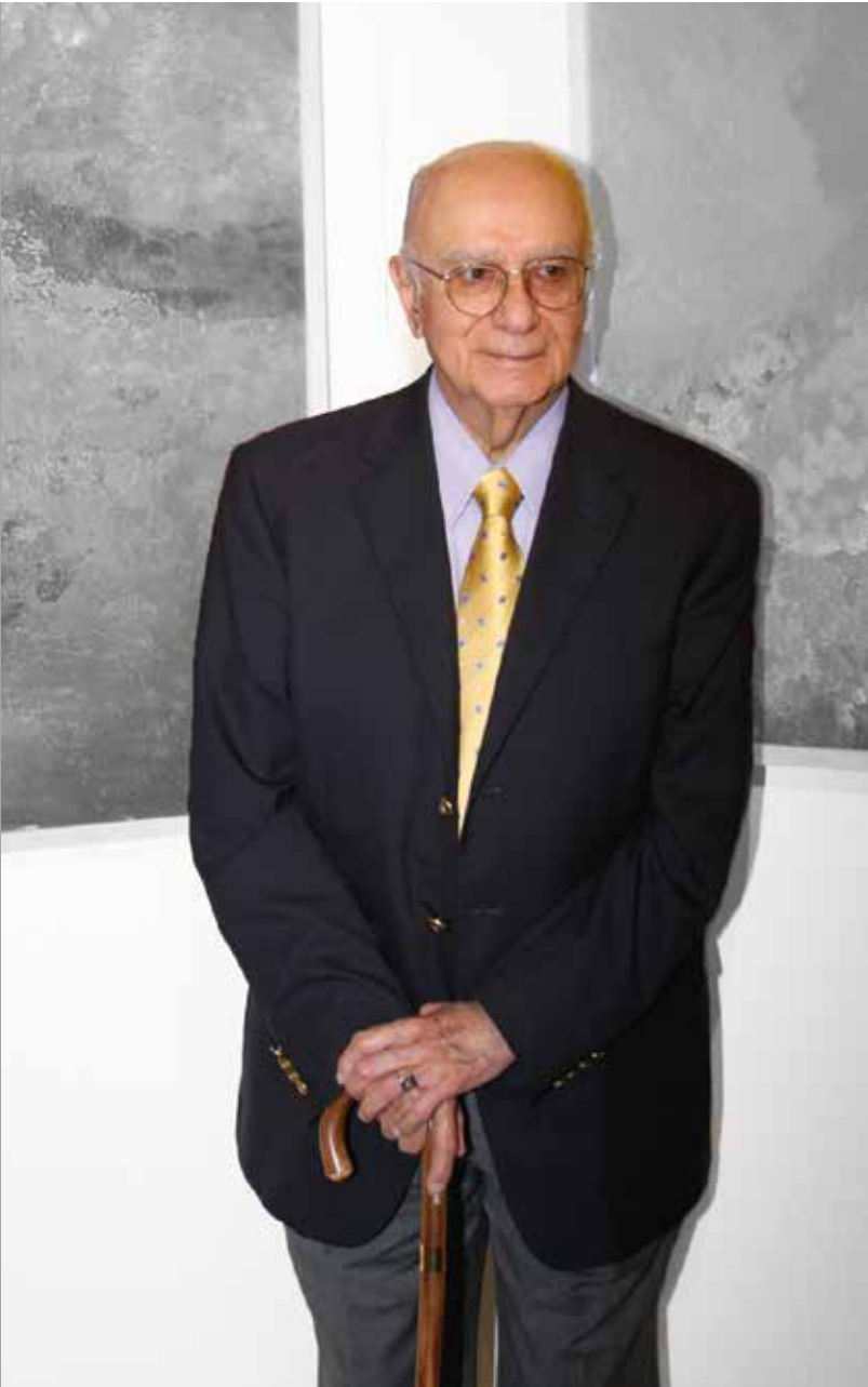
DR. OCTAVIO RIVERO SERRANO

El premio se otorga en el Día Mundial de la Salud; el cual consiste en una medalla de oro, diploma y una cantidad en numerario.